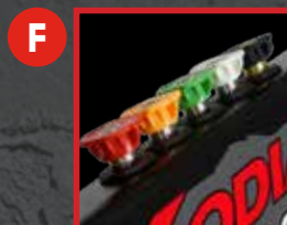
F 5 Buses de lavage