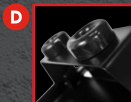
D Support frontal redessiné