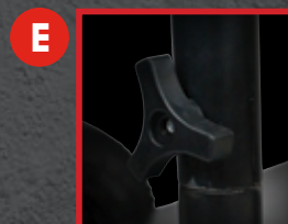
E Poignée facile à assembler