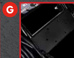
G Plaque pour dévidoir