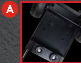
A Chassis soudé

Cette nouvelle génération CC2 au look moderne vous offre une réduction importante des vibrations, flexibilité de configurations du chariot, des crochets pour boyau et pistolet intégrés, la possibilité d'installer un dévidoir et finalement une stabilité et durabilité hors du commun.