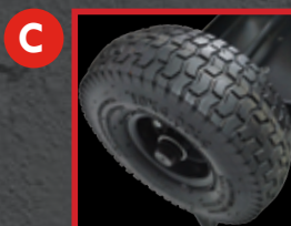
C Pneu de 10" gonflé