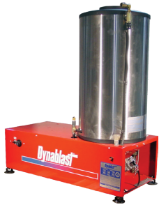
Série MHGE N/P